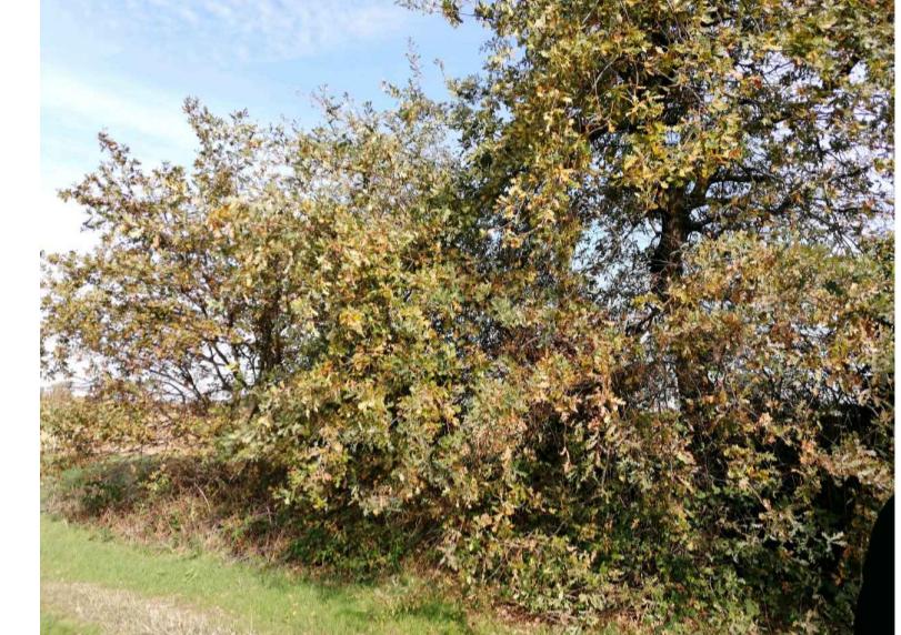
22 quercia (n.1)