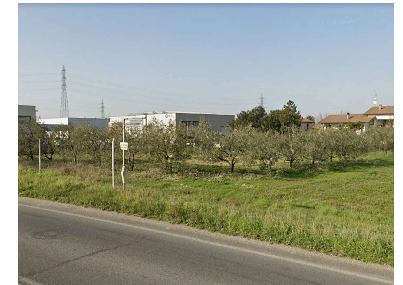
21 ulivi (n.16)