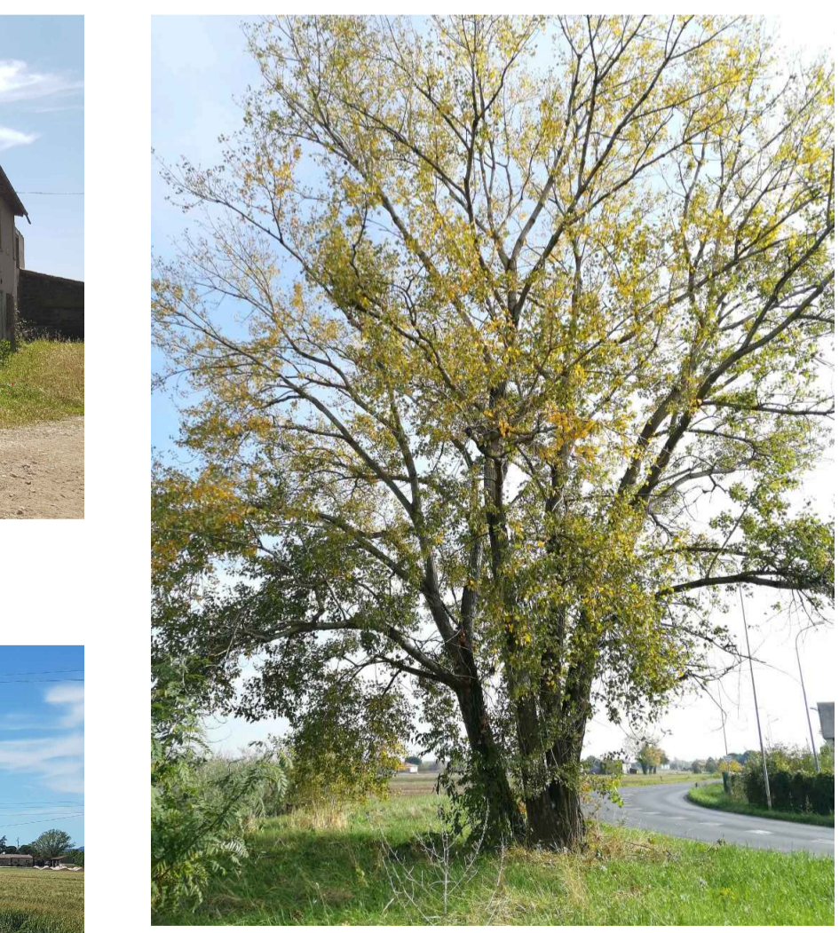
24 pioppo (n.1)