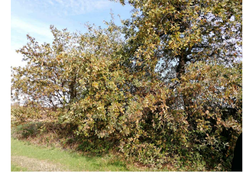
23 olmo (n.1)